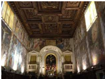
Roma, 12 aprile 2015. La stupenda sequenza di affreschi della Sala del Gonfalone ha accolto i flautisti agli Incontri Musicali Severino Gazzelloni

L'Oratorio del Gonfalone è uno dei complessi architettonici e pittorici più suggestivi della seconda metà del Cinquecento. Le scene dei dodici episodi della passione e resurrezione di Cristo sono inquadrare da una intelaiatura architettonica formata da colonne tortili ispirate alle colonne vitinee dell'antica Basilica di San Pietro, che provenivano, secondo una antica leggenda, dal Tempio di Salomone. Il ciclo fu eseguito tra gli anni 1569 e 1576, quando era cardinale protettore dell'Oratorio Alessandro Farnese. E' probabile che il compito dell'intero lavoro sia stato affidato a Jacopo Bertola, pittore parmense giunto a Roma nel 1568. L'artista però venne chiamato poco dopo dallo stesso Cardinale Farnese a Caprarola: iniziò così l'avvicendamento di numerosi artisti quali Lucio Agresti, Raffeallino da Reggio, Federico Zuccari, Cesare Nebbia, Marcantonio dal Forno e Marco Pino.