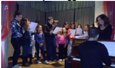
Saggio di Natale a Settecamini